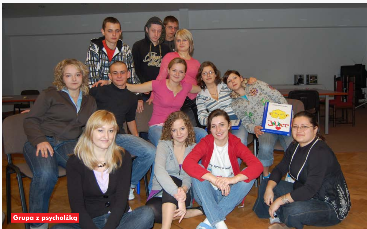
Grupa z psycholżką

projekt był już realizowany, to ciągle jeszcze coś do niego żeśmy dokładali”.