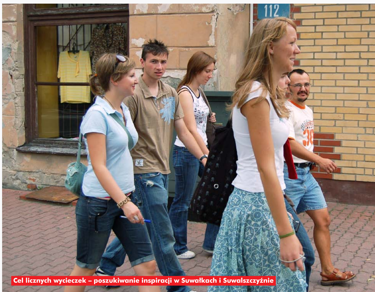
Cel licznych wycieczek – poszukiwanie inspiracji w Suwałkach i Suwalszczyźnie

Może właśnie dzięki temu projekt „KomPressJa” spełnił oczekiwania. Przede wszystkim udowodnił, że problemy wynikające z migracji istnieją także w środowisku młodych osób i chociaż najczęściej nie dotyczą ich bezpośrednio, to jednak rodzą wiele pytań, niepokoju, sprzecznych uczuć.