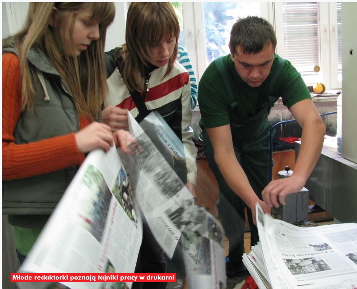
Młode redaktorki poznają tajniki pracy w drukarni

(osobisty, rodzinny, gospodarczy, kulturalny i społeczny). To m.in. te rozmowy sprowokowały słowa jednej z uczestniczek projektu: „Wyjazd jest z musu”.