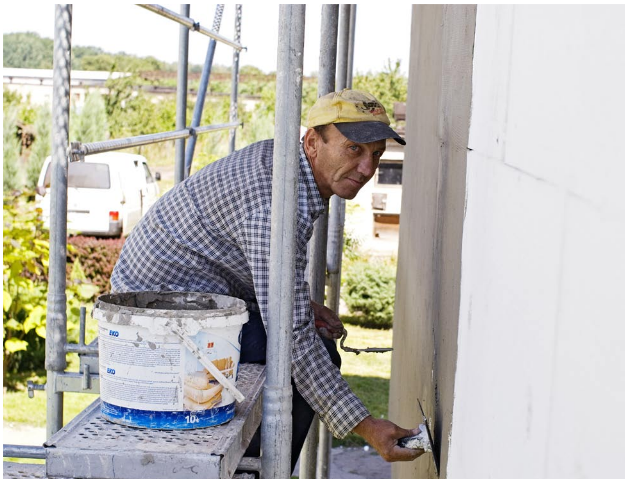
prace budowlane, Spółdzielnia Socjalna Usługowo-Handlowo- Produkcyjna w Byczynie