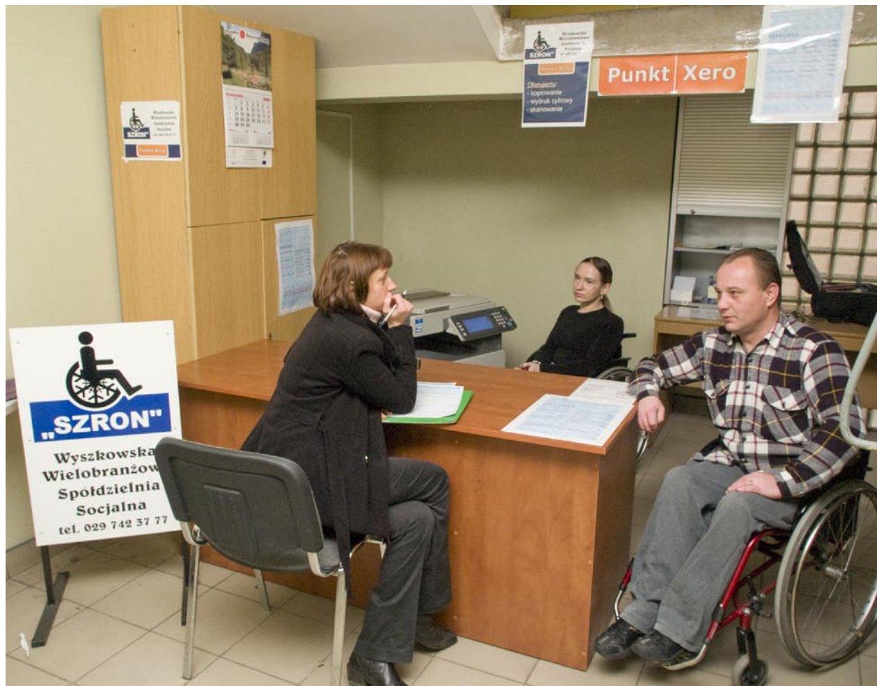
punkt ksero Wielobranżowej Spółdzielni Socjalnej „Szron” w Urzędzie Miasta w Wyszowie