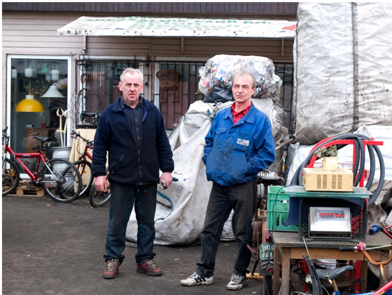
Spółdzielnia Socjalna „Karinus”, podopieczni Stowarzyszenia na rzecz Spółdzielni Socjalnych z Poznania