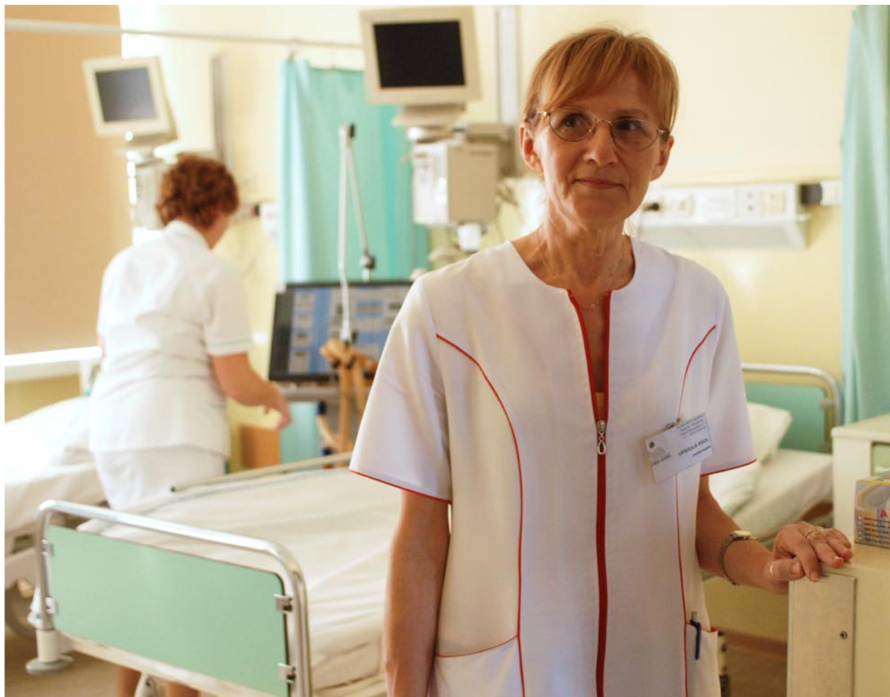
sanitariuszki ze Spółdzielni Socjalnej „Szansa i wsparcie” w Chorzowie